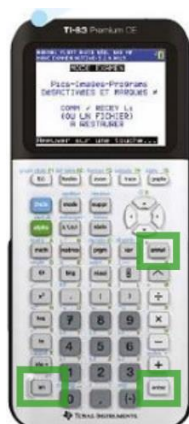
TI 83 CE