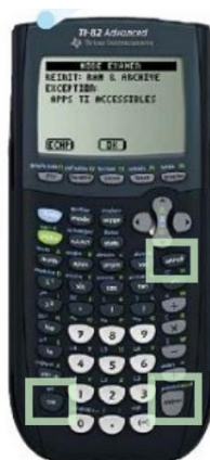
TI 82 Advanced