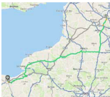
Doc. 2 151